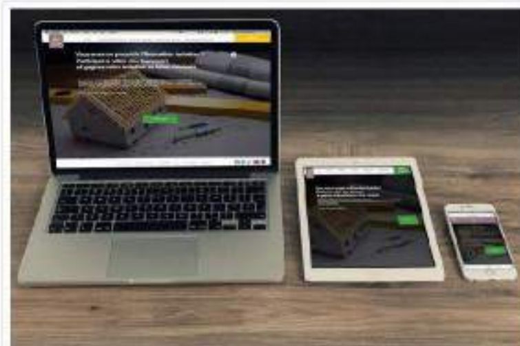
Le FILMM récompensera les 4 projets d'isolation les plus ambitieux

Natura-Sciences est partenaire du jeu-concours organisé par le FILMM, le syndicat des fabricants de laines minérales manufacturées. Vous avez un projet de rénovation Isolation Bâtiment Basse Consommation pour votre logement ? Alors, soyez parmi les 4 gagnants à recevoir l'isolation nécessaire en laine minérale !